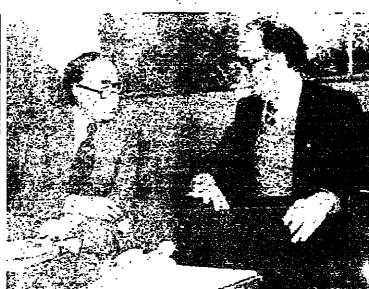
الحص في المطار مع الوزير الزري

ويكافئ، ليس هناك مجال الا لعودة واحدة بين البحر وسوريا، او بين البحر والعرب، هي الدولة اللبنانية الواحدة. فثبات الواحد هو الخيار اللبناني الوحيد، والخيار العربي الوحيد. وكان ذلك هو مجرد عنوان كبير، فانما تضع تحت العنوان سؤالا جوهريا: أي لبنان واحد؟ وعلى أية صورة تكون الوحدة؟ هل هي الوحدة التي تخفي الإقصام والتقسيم أم الوحدة التي تضمنها وتقررها التعددية؟